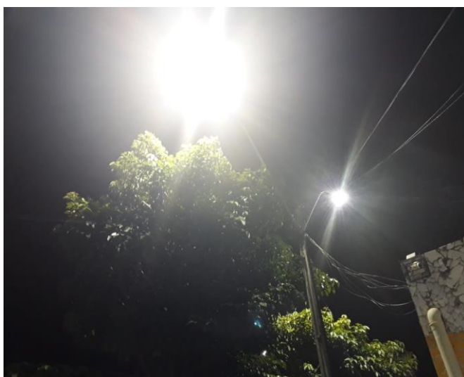
1.1- Rua da Tip Top