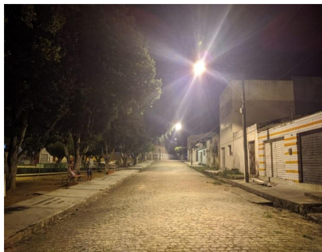
2.2- Canafístula de Frei Damião