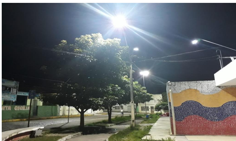
1.3-Praça do Skate

Nas fotos de tipo 1: brilho do céu (skyglow), foi possível perceber que há um desperdício de energia elétrica depositada no ambiente. A qual, foi notório perceber que