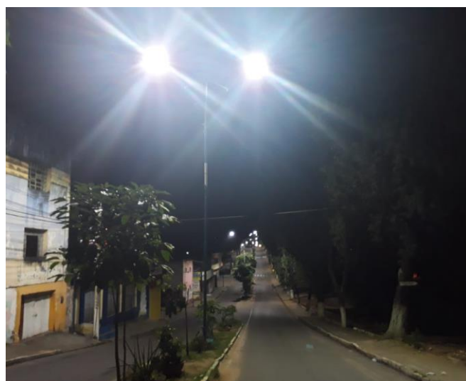
1.2 - Rua da Tip Top