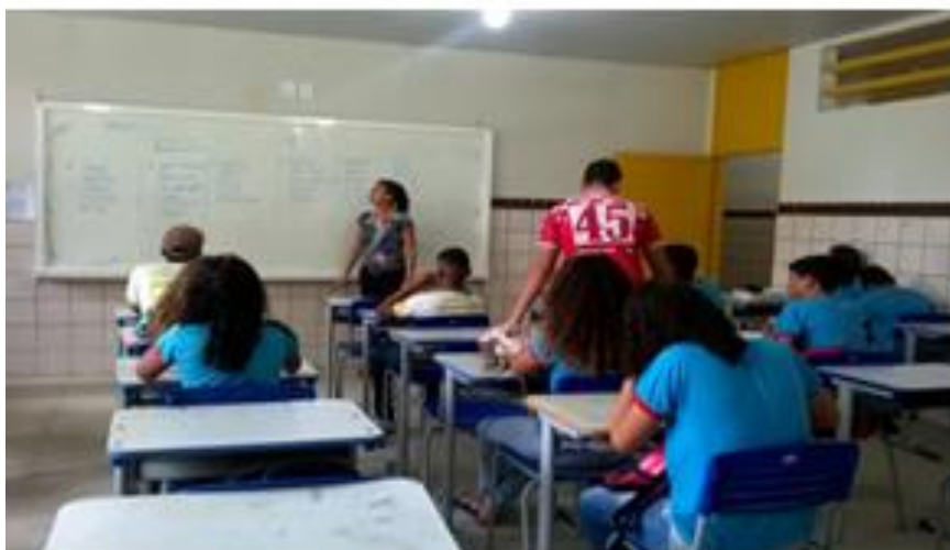
Imagem 1: Turma do 9º ano realizando o bingo geográfico.

Para iniciar, foram realizadas quatro aulas expositivas com uso do mapa-múndi e o mapa político da Europa onde os alunos tiveram a oportunidade de conhecer importantes características do continente europeu como o relevo, hidrografia, clima e vegetação, assim como os aspectos populacionais e econômicos do continente europeu. Posteriormente realizamos os jogos: Bingo geográfico e caça-palavras com a finalidade de proporcionar aos alunos um aprendizado lúdico e motivador.