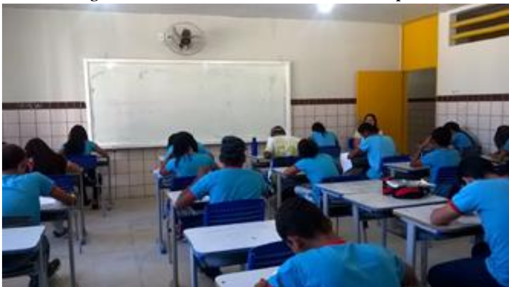
Imagem 3: Turma do 9º ano realizando o caça-palavras