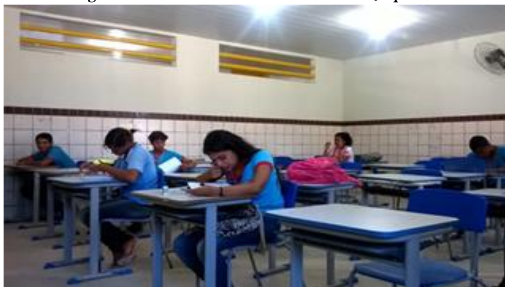
Imagem 4: Turma do PG IV realizando o caça-palavras