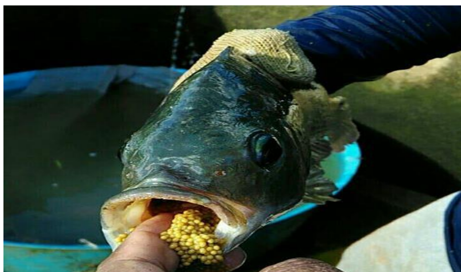
Figura 3 - Fêmea de tilápia do Nilo com os ovos na boca (incubação).

Tilápia Vermelha/Saint Peter híbrido do gênero ( Oreochromis sp ), em 1960 foi descrito o primeiro híbrido vermelho de tilápia produzido em Taiwan, um cruzamento entre uma fêmea de O. mossambicus de coloração vermelho-alaranjada com um macho normal de O. niloticus . A segunda variedade de tilápia vermelha foi desenvolvida na Flórida na década de 70, um cruzamento de uma fêmea de O. hornorum de coloração natural com um macho vermelho-dourado de O. mossambicus . A terceira variedade de tilápia vermelha registrada foi produzida em Israel, originária de tilápias do Nilo vermelhas egípcias cruzadas com tilápias azuis selvagens ( O. aureus ). A variedade Saint Peter é ovípara e os ovos são incubados na cavidade bucal semelhante à tilápia do Nilo ( Oreochromis niloticus ), tilápia azul ( O. aureus ), tilápia de Moçambique ( O. mossambicus ) e tilápia de Zanzibar ( O. hornorum ) Figura 3 (MACHADO, 2012; RECHI, 2016).