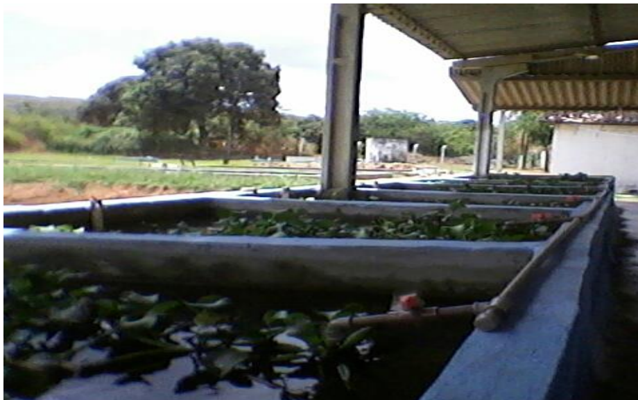
Figura 2 - Tanques de produção de peixes Ornamentais

Foram realizadas atividades rotineiras de manejo por lote e fase de criação (larval, alevinos, engorda, reprodutores e matrizes), também foi realizado a cada trinta dias o manejo com a participação de estudantes da graduação e estagiários do Laboratório de Aquicultura (LAQUA), como parte da aula prática. As atividades foram divididas em grupos conforme a necessidade do manejo como: alimentação, biometria, sexagem, coleta de larvas, qualidade da água e limpeza dos tanques. A oferta de alimento foi ministrada em horários fixos a partir das oito da manhã em todos os lotes com uma porção fixa. Para a fase larval de tilápia do Nilo ocorreram a cada duas horas a oferta de ração em pó nível de 45 a 48% de proteína bruta (PB) com o hormônio masculinizante pós-larvas 17 alfa-metil testosterona, nos horários de (08, 10, 12, 14 e 16 horas) cinco vezes ao dia no período de vinte e oito dias.