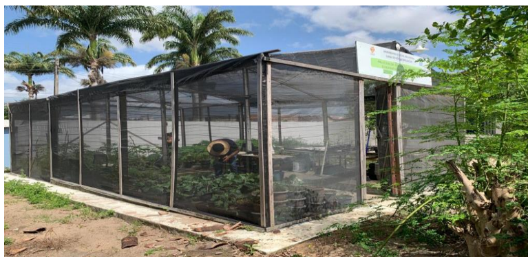
Figura 1. Estufa onde foi realizado o experimento.

A pesquisa metodológica foi baseada em Estrela (2018) e Pereira (2018) que abordam a pesquisa realizada como uma forma de organização de dados monitorados para realização de estudos estatísticos. Os estudos norteadores da parte experimental foram adaptados de Barbosa et al. (2021 e Magalhães et al., 2018). A casa de vegetação da Universidade é do tipo capela, com cobertura de tela de sombreamento específica para estufas agrícolas com sombrite a 50% e estrutura construída com madeira trabalhada (figura 1).