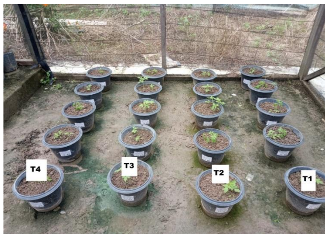
Figura 2. Vasos e seus respectivos tratamentos. T1 (testemunha); T2 (18g de fertilizante); T3 (24g de fertilizante); T4 (36g de fertilizante).