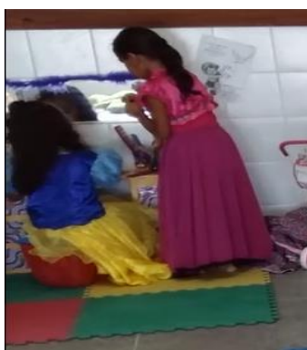
Figura 10 Eu vou querer ir bem linda pro show, bela!