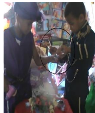
Figura 14 Eu tô tomando café!