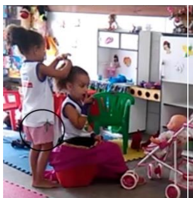
Figura 9 Aí... moça, você queria escovar o cabelo