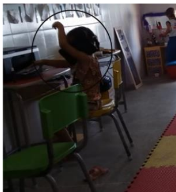
Figura 6 Eu vou brincar. Eu tô no trabalho