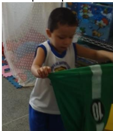
Figura 18 Hô tia! Vista aqui a roupa do Bem 10