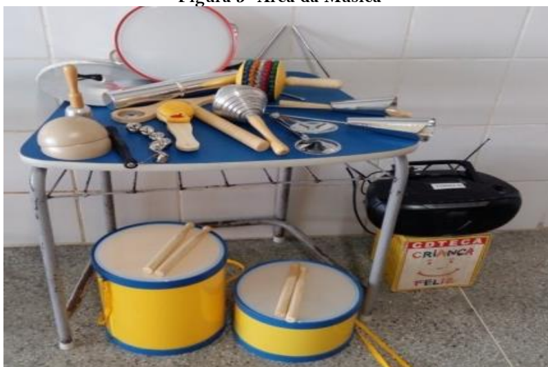
Figura 5- Área da Música