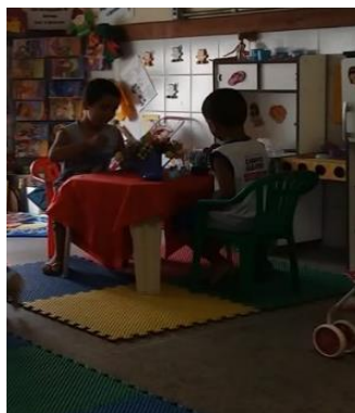
Figura 7 O Kelvin é o pai e o Rodrigo é o filho