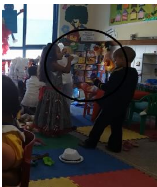
Figura 13 É... É de mintirinha!