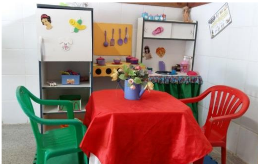
Figura 1 Área da casa