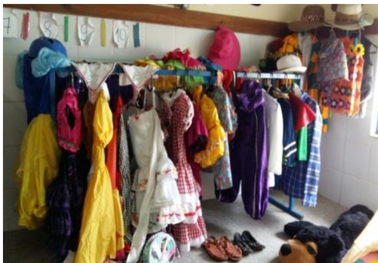
Figura 2 Área da beleza e da fantasia