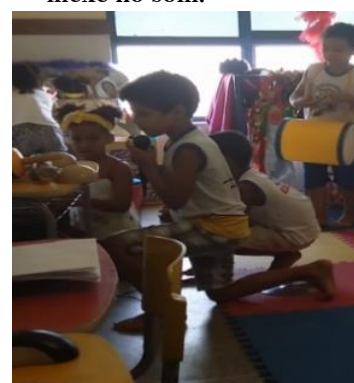
Figura 17 Você vai ser o cantor e eu vou ser a que mexe no som.