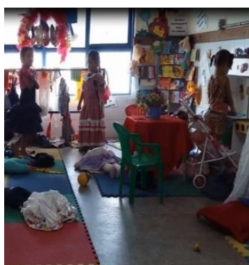
Figura 15 Agora vou apresentar aqui!