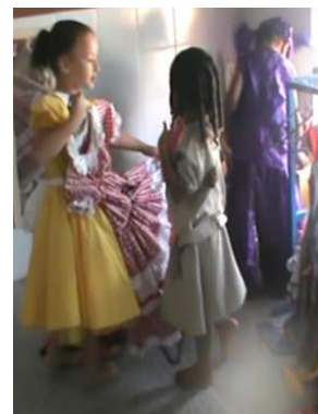
Figura 8 Você vai para o Esquadrão da Moda