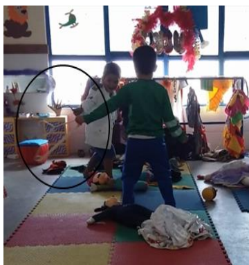
Figura 12 Venha aqui! Olha aqui! Espada do Hulk