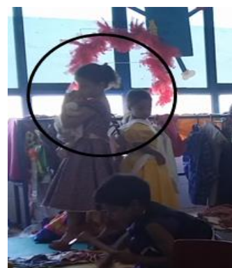
Figura 11 Hó! Pa dizer que ela é minha filha e que você é filha dela!