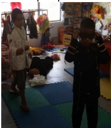
Figura 19 Quem quer ser meu príncipe?