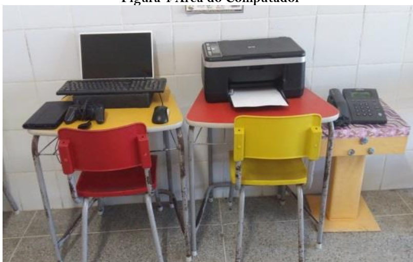
Figura 4 Área do Computador