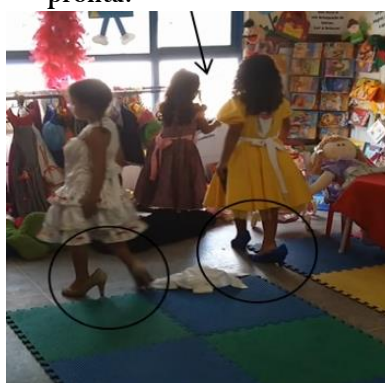
Figura 16 Começou o show gente e eu ainda não tô pronta!