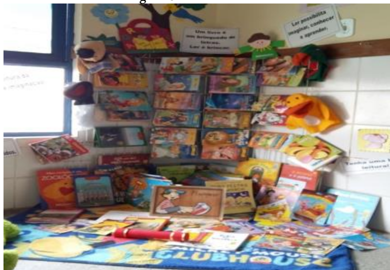
Figura 3 Área da Leitura