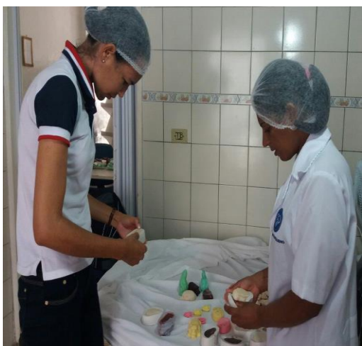
Foto- 1 Deformando os sabonetes.

Durante o estudo foi possível participar do processo de produção que começa a partir da chegada do leite na cooperativa. Inicialmente a produção começa normalmente a partir de uma limpeza da cozinha. Elas esterilizam tudo. Varrem, passam pano, lavam a forma e cozinham o leite.