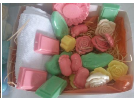
Foto-4 cesta completa.