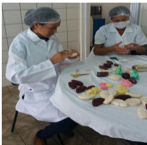
Foto-2 Plastificando os sabonetes