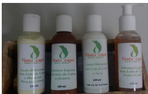
Foto-3 hidratantes e sabonete líquido.

Os principais produtos elaborados são sabonetes em barras, sabonetes líquidos, hidratantes e esponja vegetal, com a utilização do leite de cabra.